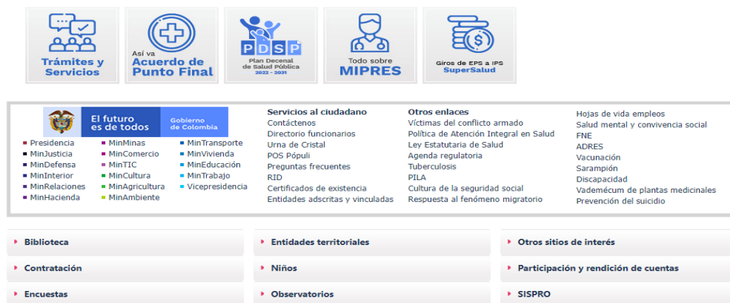
Figura No. 1 Página Ministerio de Salud y Protección Social

Ingresa a la ventanilla de trámites y servicios ya sea a través de la página principal del Ministerio de Salud y Protección Social en donde deberá ubicarse en la parte inferior de la página y allí encontrará la pestaña denominada tramites y servicios al dar enter lo remitira a la página de la ventanilla de trámites y servicios.